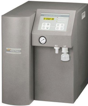
Saf Su Cihazı Marka: Human Corporation Model: New Human Power I