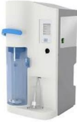
Yarı Otomatik Kjeldahl Damıtma Ünitesi Marka: Velp Scientifica Model:UDK 139