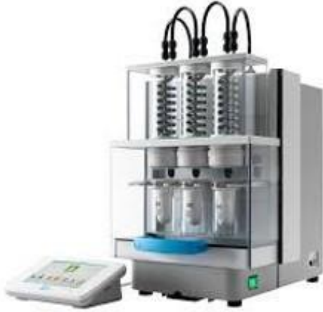
Otomatik Solvent Ekstraktörü Marka: Velp Scientifica Model: SER158