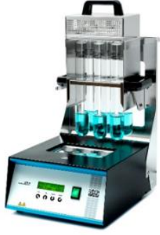
Kjeldahl Sindirim Ünitesi Marka: Velp Scientifica Model: DK6